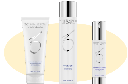
基本セット (洗顔、化粧水、日中美容液)