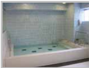
広々浴室で リラックスタイム