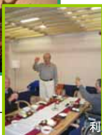
利用者さんの掛け声で「乾杯」