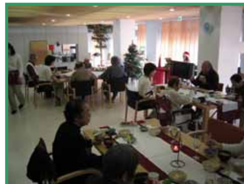
クリスマス限定ランチや生演奏で スタッフも盛り上がりました