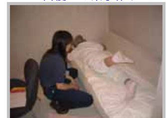
専門職より運動の アドバイス