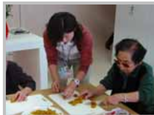
おやつ作りを 分担して