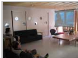
スクリーンで 映画鑑賞