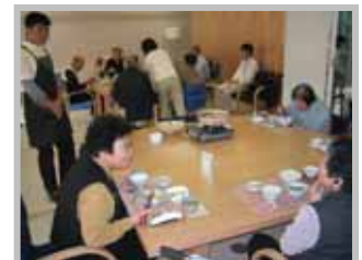
昼食メニューは 「牡蠣鍋」でした