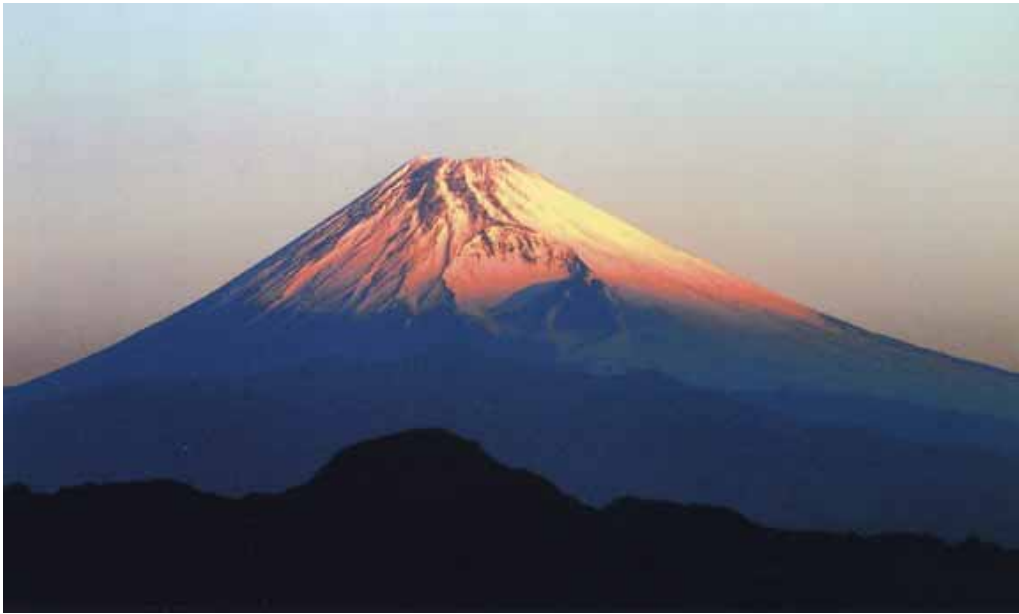
齊藤正男会長 撮影 2003.01

ホームページアドレス http://www.kasumi-gr.com/ メールアドレス info@kasumi-gr.com