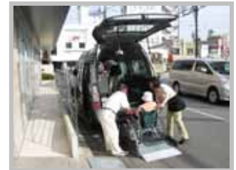
送迎車でらくらく 外出