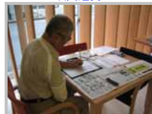
自己練習 「書道のようす」