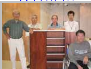
男性の共同制作 「下駄箱」完成