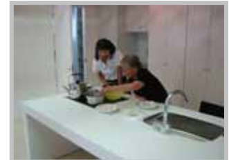
キッチンで 自慢のお菓子作り