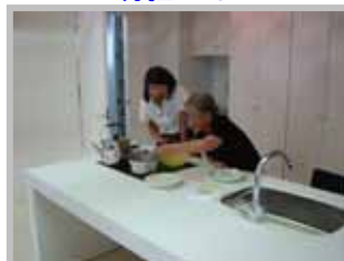
キッチンで 自慢のおかし作り