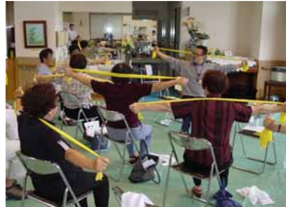
【健康フェア2004 「理学療法士による“らくらくリハビリ体操”】

さて今年の「健康フェア」は平成17年6月25日(土)に霞ヶ関南病院にて開催されます。テーマは「生活習慣病・体力低下・もの忘れ」です。これらの症状が気になったら、どうしたらいいのでしょうか？ そんな疑問に「食事・運動・医学的知識」の観点から、参加体験型講座でお答えしていきます。