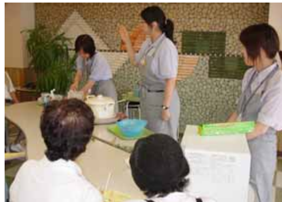
【健康フェア2004 「管理栄養士による“やせる!?食事教室”】

また、病院内ガレリアにおいて「ちょこっとコーナー」というブースを設け、フットケアや、サプリメント相談、血圧や体組成などの身体測定、健康茶の紹介、医師による健康相談など、お気軽に体験できるコーナーもご用意しました。