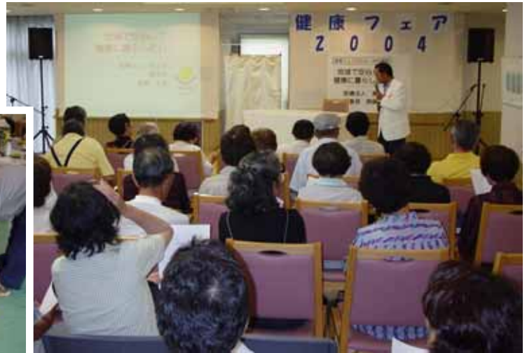
健康フェア 2004 から