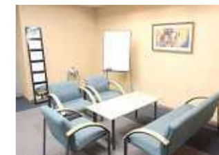
カンファレンスルーム