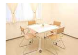
カンファレンスルーム