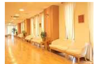
待合コーナー(診察室前)