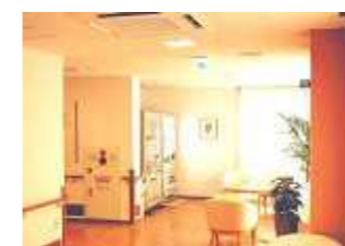
休憩コーナー(自販機前)