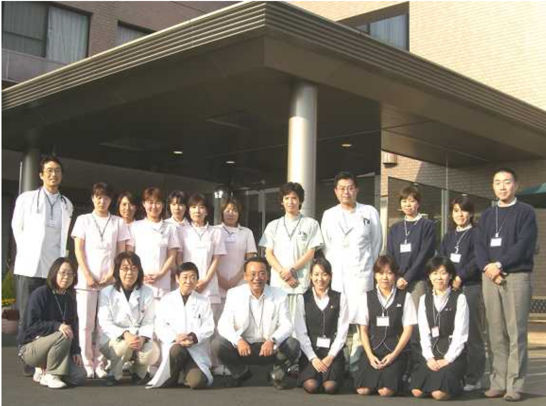
最高のチームワークで地域の皆様にお応えします。(外来担当チーム)

ホームページアドレス http://www.kasumi-gr.com/ メールアドレス info@kasumi-gr.com