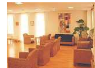
待合コーナー(受付前)