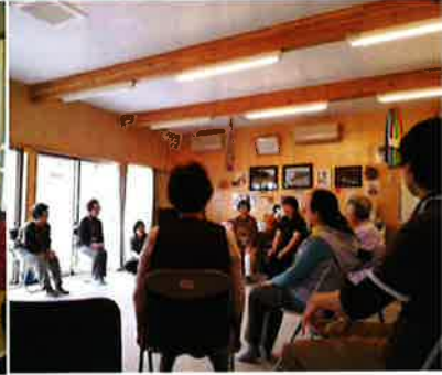
仮設住宅への巡回支援活動の風景から

今年も福島へのボランティア活動が始まりました。郡山や白河など、仮設住宅や借り上げ住宅にお住まいの双葉町の皆さんのところへです。