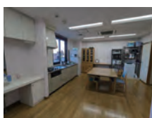
③ 日常生活動作 (ADL・IADL)