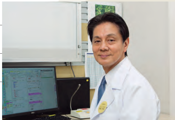
かすみケアグループ 医療法人真正会 霞ヶ関南病院 病院長

今年度、霞ヶ関南病院の属する“かすみケアグループ”では夏に真寿園向かいに在宅サービスとグループホームの機能をもった小規模多機能型居宅介護併設認知症対応型共同生活介護事業所「園 (SONO)」を開設します。また秋には南病院北側に「あいなクリニック」も開院し皮膚科専門外来を始めます。この建物にはいろいろな研修や教室を開催できるスタジオを併設し地域の皆さまの向学、福祉、ボランティ