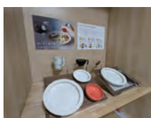
② 食事・調理 支援グッズ