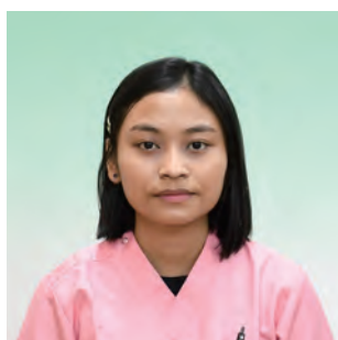
ニン・テツ・テツ・ナインさん

実習生の先輩からも色々とアドバイスを受け、日本の生活に早く馴染めるよう一生懸命に頑張っています。