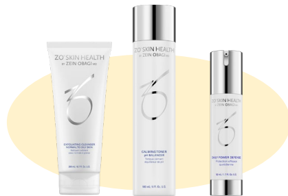
基本セット (洗顔、化粧水、日中美容液) ※トライアルセット その他商品もあります