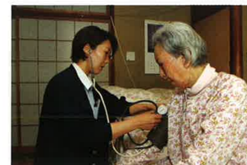
訪問看護 (訪問看護ステーション スマイル)