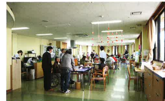
通所リハビリテーション (デイホスピタル)