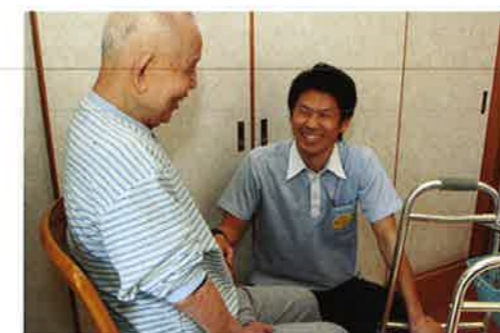
訪問リハビリテーション (霞ヶ関中央クリニック)