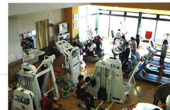
健康増進施設 (SKIP トレーニングセンター)