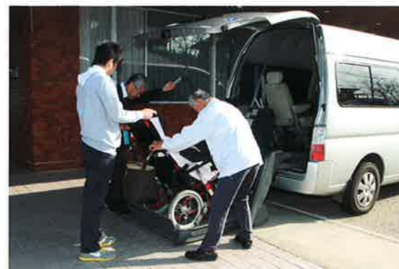
通所リハビリテーション (デイリハビリテーションセンター)