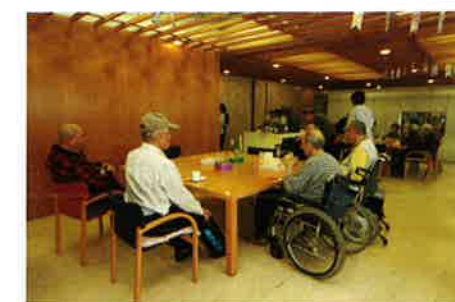
通所介護 (ケアラウンジ南大塚)