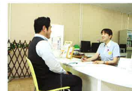
地域包括支援センター (だいとう)